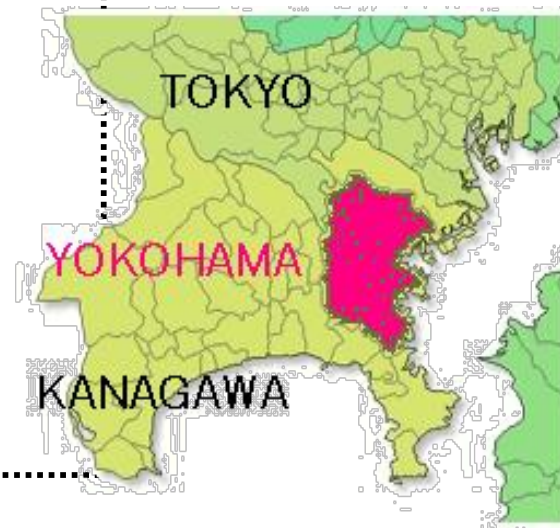
【横浜市の将来人口推計値 年齢3区分の割合】